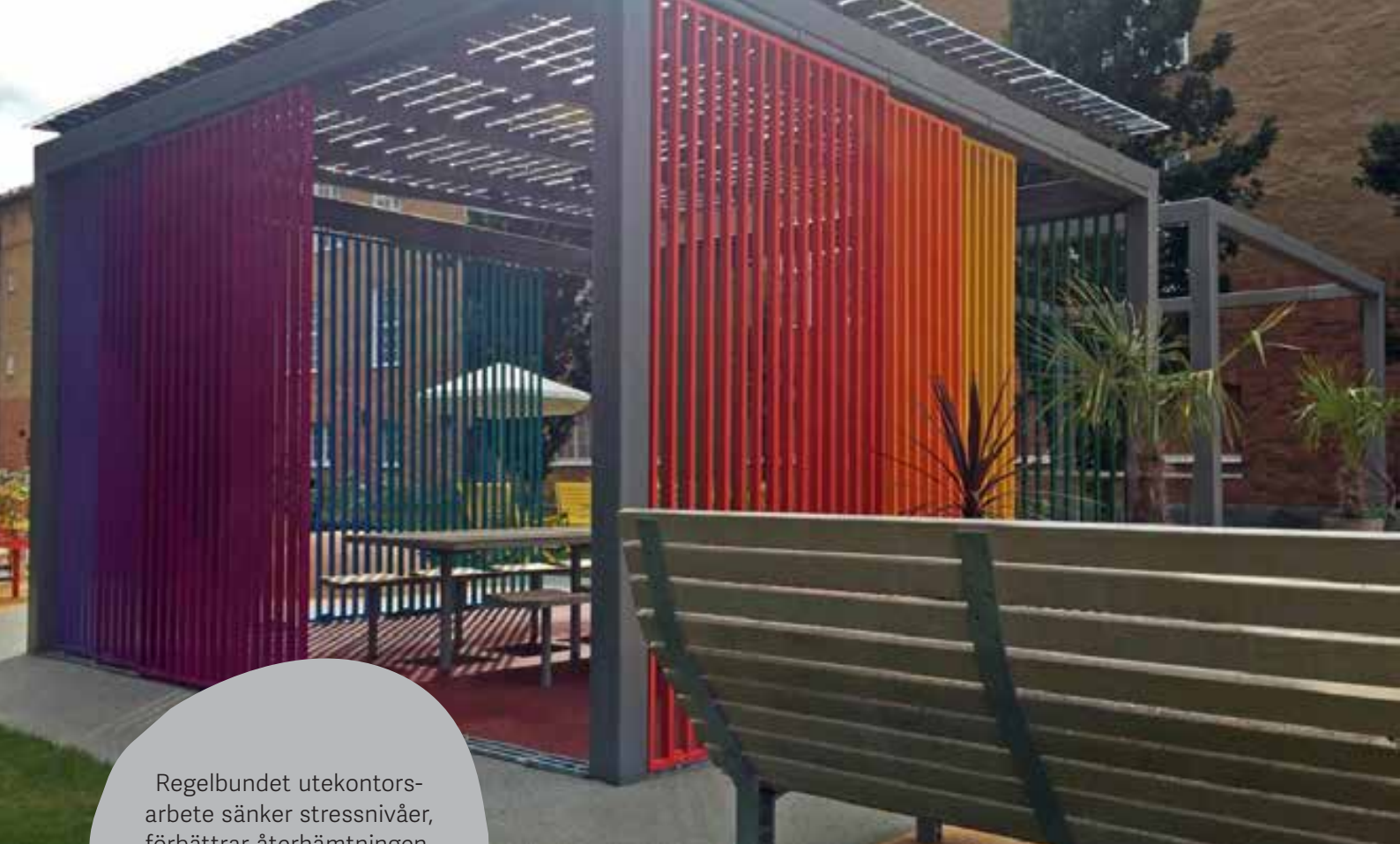
Castellum WorkOUT Växjö

Regelbundet utekontorsarbete sänker stressnivåer, förbättrar återhämtningen, ökar kreativiteten och gör oss friskare, gladare och piggare.