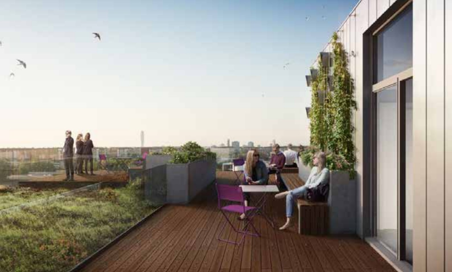
Kontorshus med takterrass, Hyllie, NCC