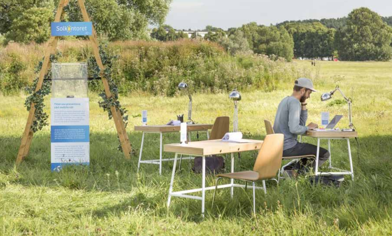
Telenor Solkontoret, mobilt utekontor