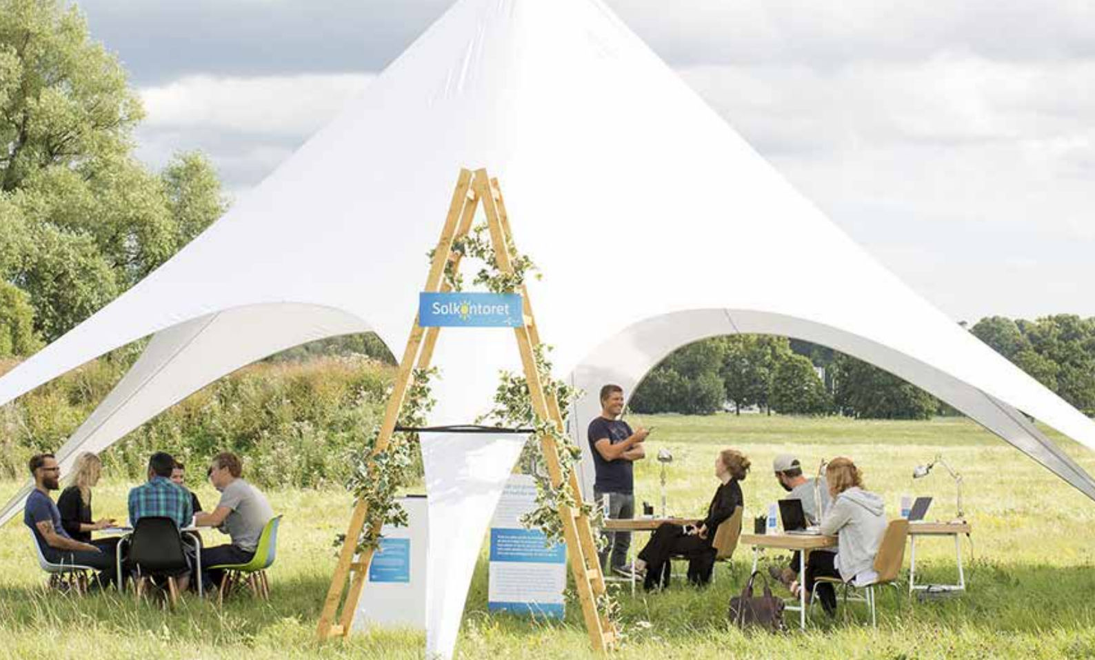
Telenor Solkontoret, mobilt utekontor

Resultaten från dessa två pilotprojekt är i linje med tidigare forskning: 16 medarbetare är mycket intresserade av att testa utekontor och ser möjligheten som ett viktigt inslag i framtidens kontor. Pilotprojekten ger också viktig information om vilken typ av utomhusmiljöer som medarbetare föredrar, vilka arbetsuppgifter som lämpar sig att göras utomhus och vilken typ av hjälpmedel som behövs för att stödja utekontorsarbete.