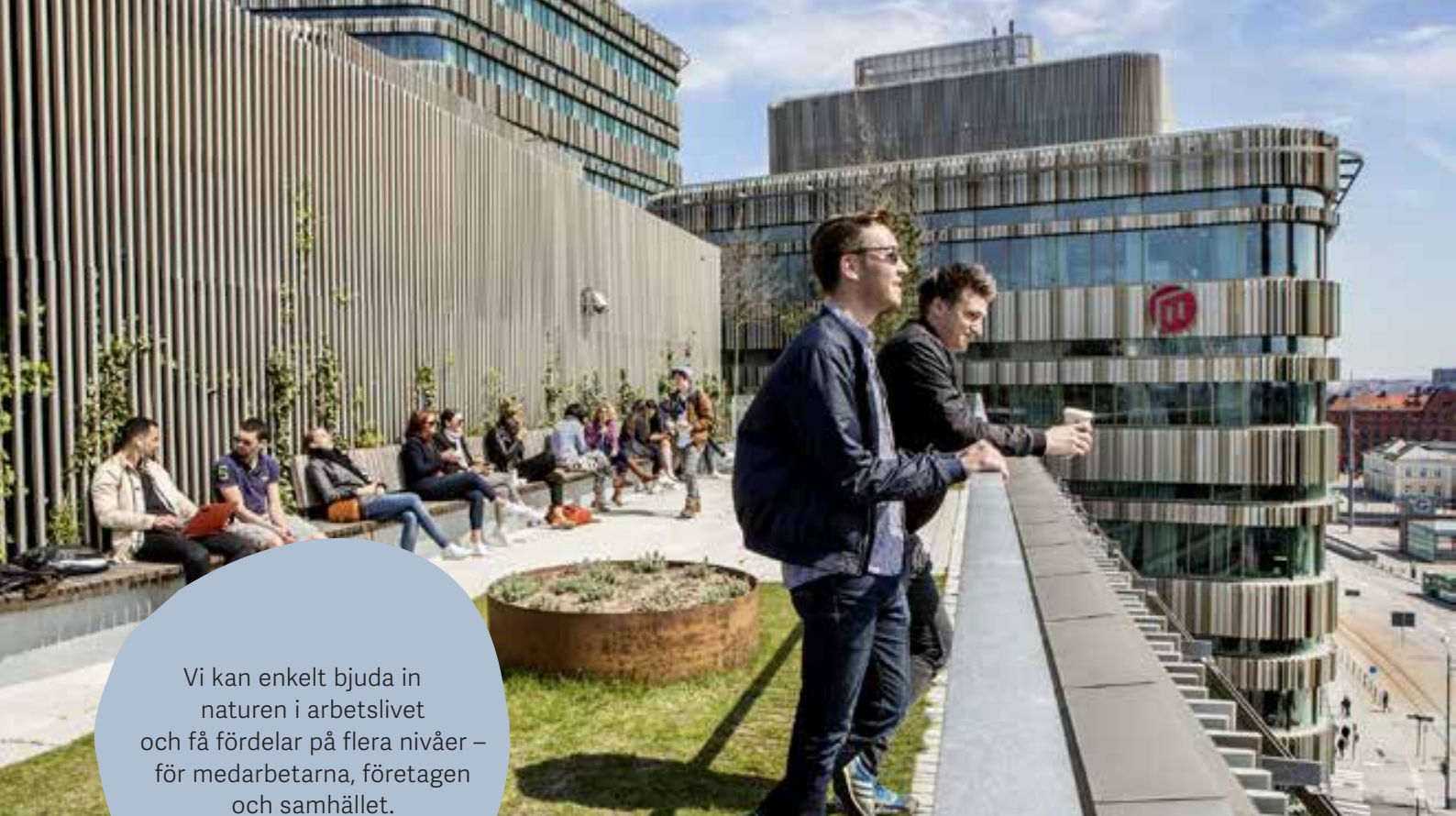
Malmö universitet, takterrass Niagara

Vi kan enkelt bjuda in naturen i arbetslivet och få fördelar på flera nivåer – för medarbetarna, företagen och samhället.